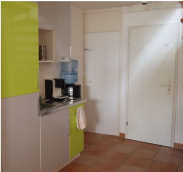
Teeküche mit extra hellen Farben